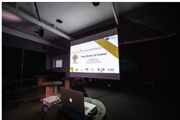
Fotos tomadas por CURVA POLAR durante el evento "Diversidad Creativa" del 25 de marzo de 2022-Roma

Los socios de formación italianos EUROSVILUPPO y SKILL UP con el apoyo de TEVERE ART GALLERY ya han organizado dos eventos de difusión del proyecto TD! y sus objetivos - 9 de octubre de 2021 - y han presentado los vídeos realizados por cada país socio para los Conjuntos Creativos basados en la diversidad de género, cultural y mental durante el evento del 25/03/2022 donde se ha convocado una CONVOCATORIA de Artistas para noviembre de 2022.