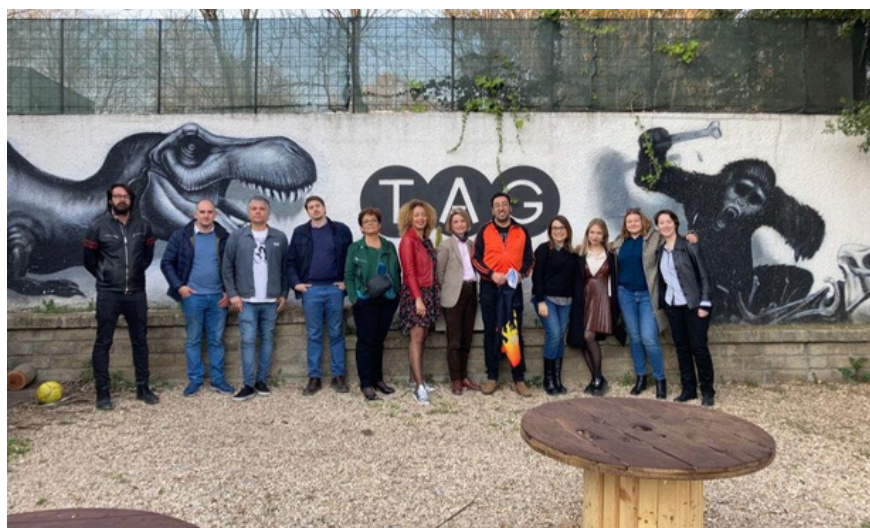
Preparando el evento del 25 de marzo de 2022 en TAG - todos los socios, ROMA