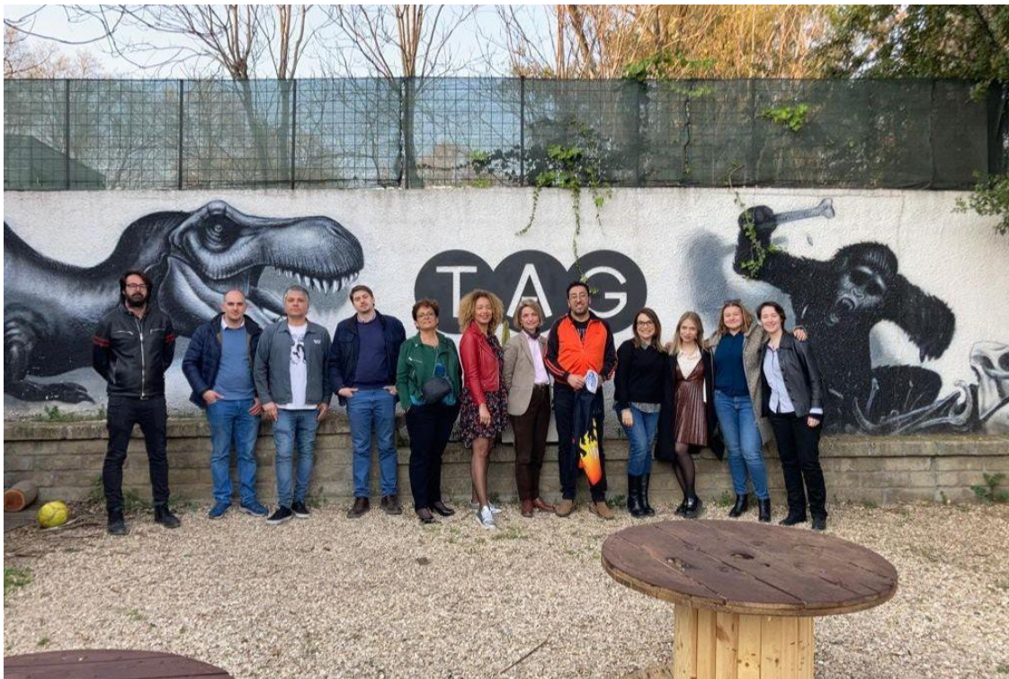
Préparation de l'événement du 25 mars 2022 à TAG - tous les partenaires, ROME