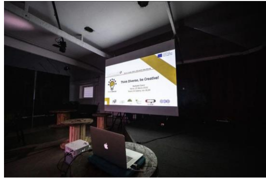
Photos prises par CURVA POLAR lors de l'événement "Diversité créative" du 25 mars 2022-Rome

Les partenaires de formation italiens EUROSVILUPPO et SKILL UP avec le soutien de TEVERE ART GALLERY ont déjà organisé deux événements de diffusion du projet et ses objectifs - 9 octobre 2021 - et présenté les vidéos réalisées par chaque pays partenaire pour les Sets Créatifs basés sur le genre, la diversité culturelle et mentale lors de l'événement du 25/03/2022 où un APPEL aux Artistes a été lancé pour novembre 2022.